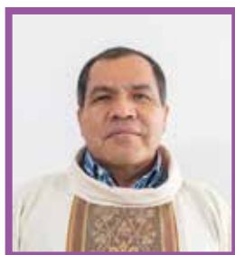
Pbro. Ignacio López Reyes Vicario Episcopal